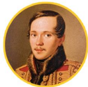
Михаил Юрьевич Лермонтов